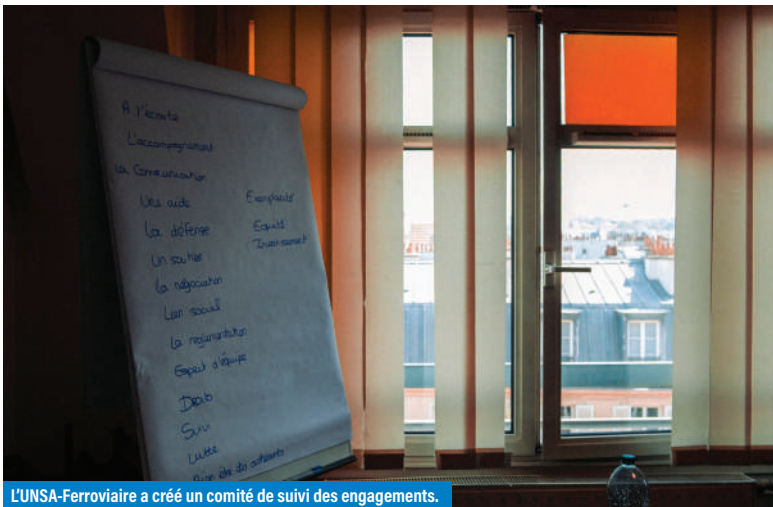
L'UNSA-Ferroviaire a créé un comité de suivi des engagements.

Sur le sujet de l'ouverture à la concurrence et de la filialisation, le clivage syndical est net. Fidèle à ses valeurs, l'UNSA-Ferroviaire a fait le choix de protéger concrètement les salariés concernés plutôt que de se contenter de dénoncer un processus inscrit dans la loi. Pour nous, prendre ses responsabilités, c'est garantir qu'aucun-e cheminot-e ne soit le perdant social de ces transformations.