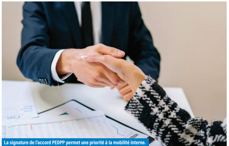
La signature de l'accord PEDPP permet une priorité à la mobilité interne.

Face à ces mutations, l'UNSA-Ferroviaire a œuvré pendant plus de deux ans et demi pour conclure l'accord sur le Pilotage de l'Emploi et le Développement des Parcours Professionnels (PEDPP). Signé en novembre 2024, ce texte a pour ambition de clarifier les règles du jeu. Trop souvent, l'accès à l'information sur les métiers en tension ou en croissance restait opaque. Désormais, chaque salarié doit pouvoir identifier les opportunités réelles et connaître précisément les conditions d'accès à de nouvelles fonctions via des parcours de formation renforcés . Pour nous, l'évolution au sein du groupe ne doit plus être un parcours du combattant mais un droit accessible à tous, grâce à l'acquisition de nouvelles compétences. Pour l'UNSA-Ferroviaire, cet accord est une victoire stratégique : il remet le salarié au centre des décisions et harmonise enfin les droits entre statutaires et contractuels, garantissant une équité de traitement indispensable dans le groupe d'aujourd'hui.