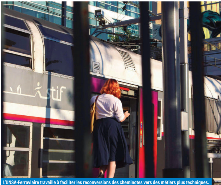
L'UNSA-Ferroviaire travaille à faciliter les reconversions des cheminotes vers des métiers plus techniques.

Plus largement, nous défendons une plus grande mixité des profils et des parcours. Pour l'UNSA-Ferroviaire, une réelle diversité des formations, des expériences, des approches, mais aussi des singularités (handicap, neurodivergence, etc.) concrétisée dans les embauches et les évolutions de carrière est une véritable source de performance. Être une entreprise inclusive doit être une réalité quotidienne sur le terrain, pas seulement un slogan pour les forums de recrutement s'appuyant sur quelques « exceptions consolantes » !