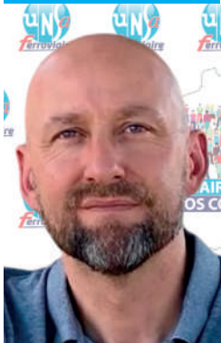
Par Fabrice CHARRIÈRE

Plus que jamais, notre force, c'est vous.