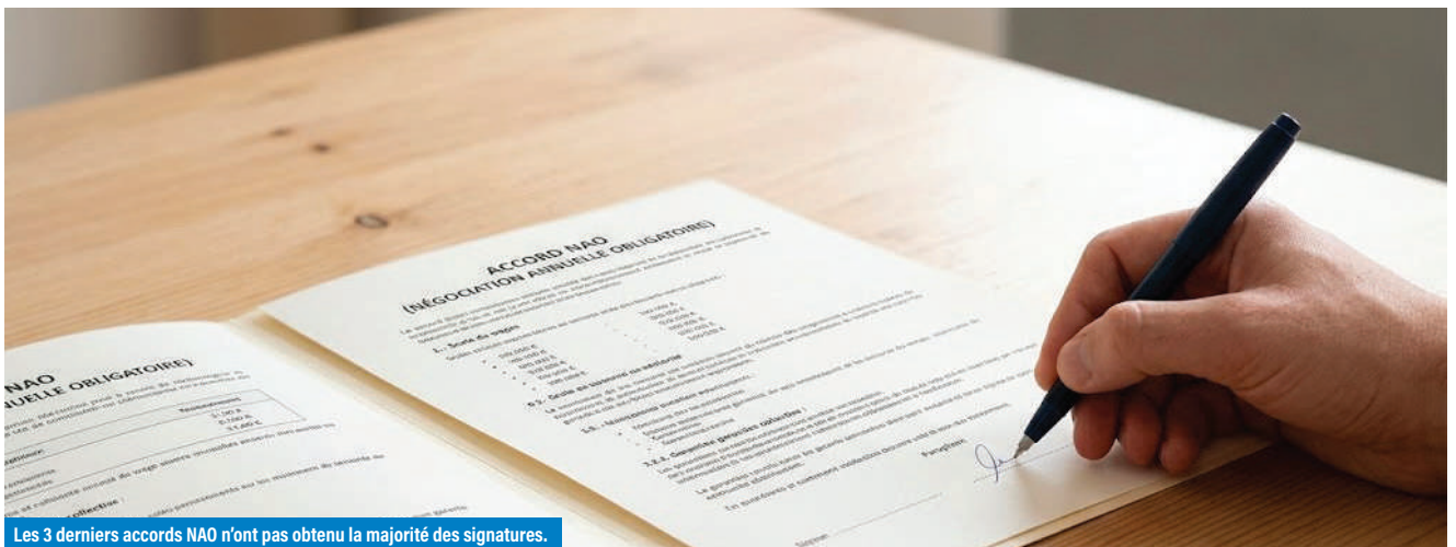
Les 3 derniers accords NAO n'ont pas obtenu la majorité des signatures.

Quatre ans, quatre NAO, un accord fin de carrière, un dispositif de protection sociale complémentaire. Les chiffres ne tombent pas du ciel. Ils sont arrachés table après table, signature après signature, dans un contexte où l'inflation a effacé en quelques mois ce que des décennies de négociations avaient patiemment construit. L'UNSA-Ferroviaire n'a jamais quitté la salle. Elle n'a pas davantage signé les yeux fermés. Ce bilan dit ce qu'elle a obtenu, ce qu'elle a refusé, et ce qu'il reste à conquérir. Et prouve que la négociation paie... car en l'absence d'accord majoritaire, c'est la signature de l'UNSA qui force la direction à mettre en œuvre les mesures négociées.