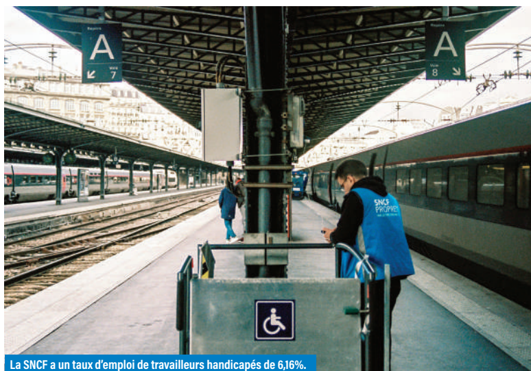
La SNCF a un taux d'emploi de travailleurs handicapés de 6,16%.

▪ La protection lors des réorganisations : un volet spécifique et anonyme doit désormais obligatoirement identifier, traiter et accompagner chaque projet de réorganisation (communiqué au CSE/CSSCT) pour détailler les démarches d'aménagements de postes ou les obligations de reclassement, évitant ainsi toute stigmatisation ou oubli des agents concernés.