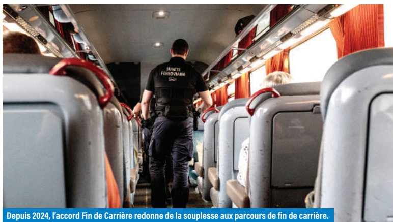
Depuis 2024, l'accord Fin de Carrière redonne de la souplesse aux parcours de fin de carrière.

point dédié pour que chaque fin de carrière soit anticipée et accompagnée individuellement.