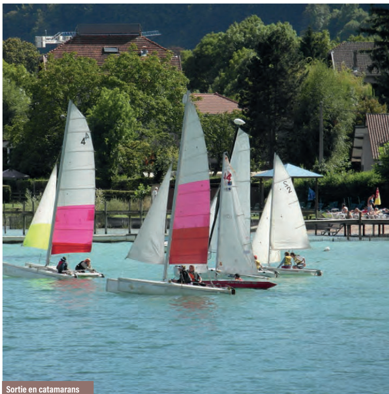
Sortie en catamarans

S'il vous fallait une preuve de plus, nos propres enfants y vont chaque année !