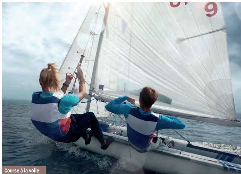
Course à la voile

Régimes alimentaires : sur les 71 jeunes, il y en avait cinq sans viande porcine, trois végétariens, un sans lactose ainsi que quelques véganes chez les animateurs. Tous les repas sont mis à disposition sur les tables du restaurant. À partir de 9h, les boissons chaudes ne sont plus proposées, les cuisiniers se recentrent sur la préparation du repas du midi. Le site ne fonctionne pas avec le