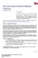
Note Jours d'absence