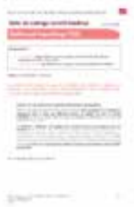
Réfèrent handicap CSE