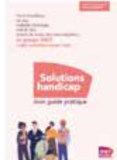
Guide Solutions Handicap