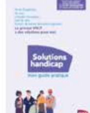
Guide Solutions Handicap Managers et RH