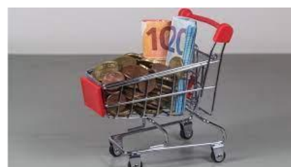
Table Ronde Salaires