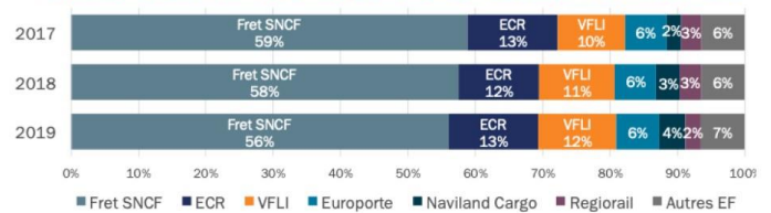
Répartition des trains.km par entreprise ferroviaire de transport de marchandises